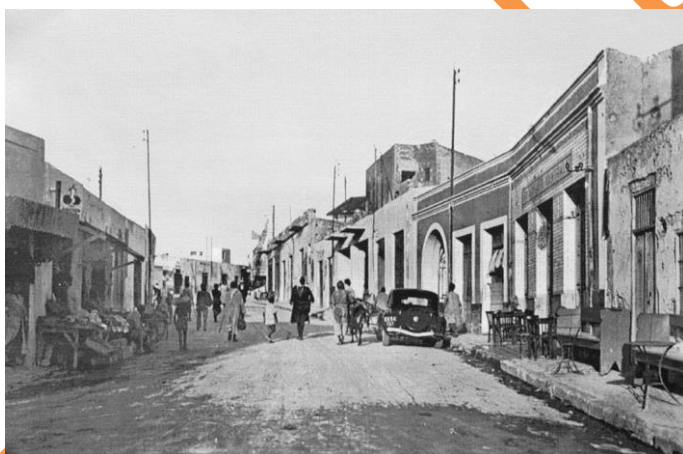
Mateur des années 50